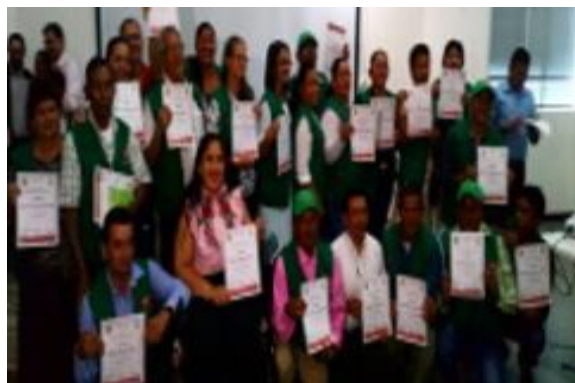
Figura 2: Evento de Clausura

Si hay un incumplimiento del acuerdo, el juez suspende la investigación y da continuidad a lo señalado en el acuerdo.