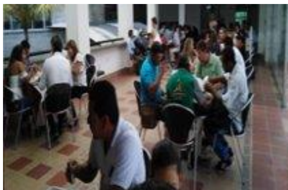
Figura 4: Capacitaciones a los conciliadores en equidad en Tame, Arauca.