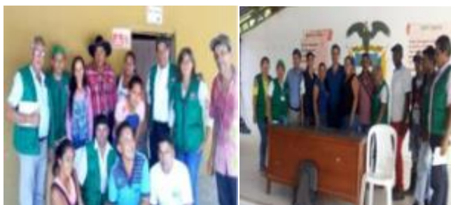
Figuras 5 y 6: San Salvador y Puerto Jordán

Sin embargo, los conciliadores fueron conscientes de las barreras que impiden el acceso, por ejemplo, geográfico, económico o cultural. En ocasiones los campesinos temen acercarse al juez por factores económicos y de otra índole. Es ahí donde los conciliadores en el campo y la zona urbana pensaron “tenemos que ayudar a nuestra gente del campo” y es donde se da la iniciativa de crear los Terminales de Justicia. En Tame se crea un acuerdo municipal sobre el tema local de justicia, donde no se mira la conciliación como una forma de desatascar el aparato judicial, sino más bien como el alcance a las diferentes comunidades para la solución de sus conflictos.