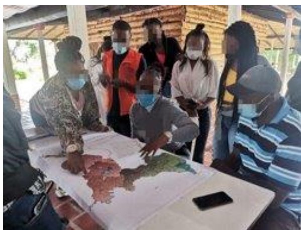
Figura 9: Mapeo para la Estrategia de Protección Comunitaria

Esta estrategia tiene como objetivo potenciar las prácticas de autocuidado y protección que promueven comunidades e institucionalidad para que niñas, niños, adolescentes y jóvenes ejerzan su derecho a la participación de forma segura y protegida, mediante el fortalecimiento de capacidades comunitarias, incidencia política, articulación institucional, orientación psicosocial, y asesoría legal.