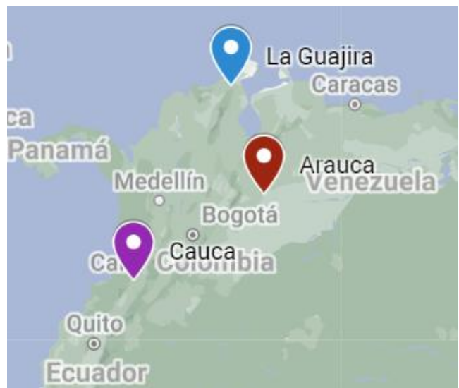
Figura 1: Mapa indicando ubicación de los tres ejemplos.