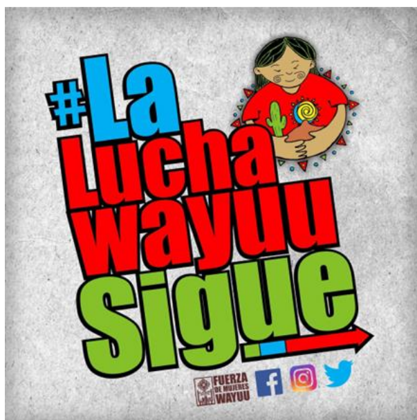
Figura 8: Logotipo de la Fuerza de Mujeres Wayuu

Se puede considerar este colectivo como una forma de lucha desde abajo con un enfoque de género contra la violencia, como arquitectas de la paz y un modelo a seguir en otras partes del país que presentan retos similares. La Guajira es una zona de estudio para el Programa CONPEACE, y el enfoque de un escrito previo que se puede encontrar aquí .