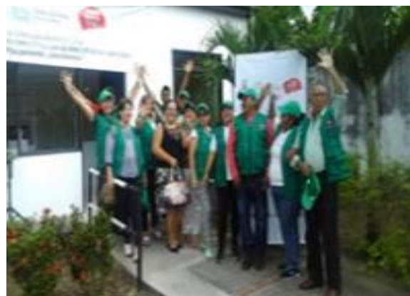
Figura 3: Inauguración y puesta en marcha del punto de Conciliación