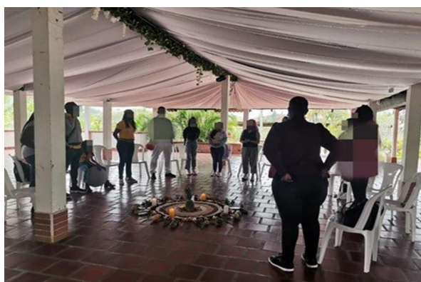
Figura 11: Respetando a las cosmovisiones étnicas

Esta mirada de seguridad reconoce los saberes de las comunidades, sus estrategias de cuidado y autocuidado en las que participan no sólo hombres, sino también mujeres, niñas, niños y adolescentes.