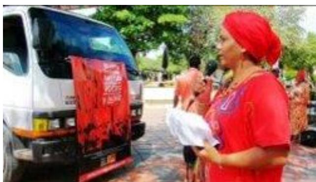
Figura 7: Mujeres indígenas Wayuu alzadas en voces para la protección y la paz

Las mujeres de varias partes de La Guajira intensificaban su nivel y capacidad de organización colectiva, por ejemplo, lanzando campañas de sensibilización en torno al impacto devastador de la minería sobre las comunidades, o publicando críticas hacia las empresas multinacionales, su explotación violenta de los recursos de la región y el abandono estatal.