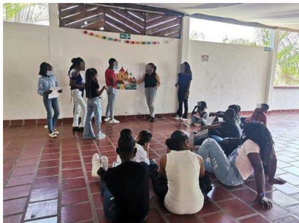
Figura 10: Trabajo colectivo en la Estrategia

Para construir esta Estrategia fue necesario acercarse a una visión alternativa de la seguridad que fuera coherente con las comunidades afrodescendientes e indígenas que habitan el Norte del Cauca, con sus luchas y sus procesos organizativos. Esta visión pasa por la inclusión de otras perspectivas distintas al militarismo, cuyas estrategias están basadas en el uso de la fuerza, la competencia y la eliminación del otro o de la diferencia. Por el contrario, otro paradigma de seguridad rescata los valores del cuidado colectivo, de la cooperación con la vida humana y no humana, donde principios como la inclusión y la sostenibilidad son fundamentales.